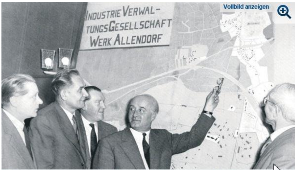
Ein Bild aus der Ausstellung des DIZ Stadtmuseum