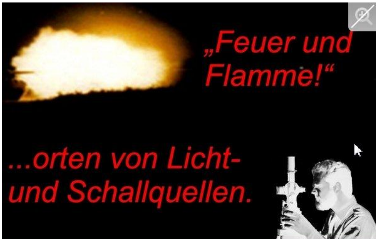
In der Militärgeschichtlichen Sammlung in Stadtallendorf geht es am Museumssonntag um das Orten von Licht- und Schallquellen