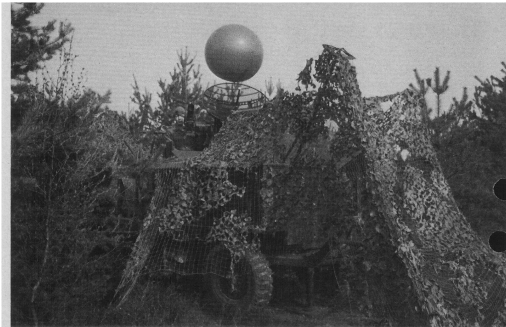
Höhenwindradar D VII B gut getarnt Nutzungszeit 1967-1971