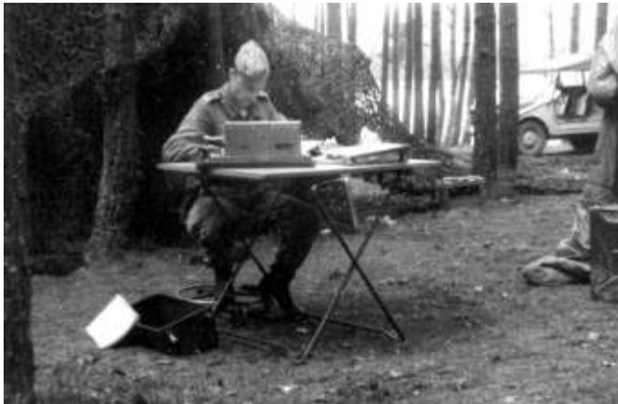
Fw Wolff mit der Brunsviga Rechenmaschine im Herbst 1970 in Grafenwöhr

Typ: Brunsviga, mechanische Rechenmaschine Hersteller: Brunsviga, Braunschweig Baujahr: ab 1956 Preis: ca DM 2700.-