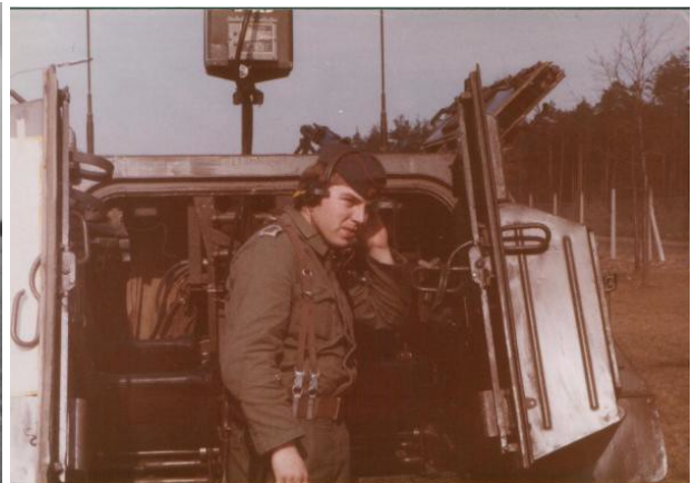
...Ausbildung der ArtBeoArtGrp TPS33 hinter dem Block 15 an der Pz-Straße (hier SU Biesold).