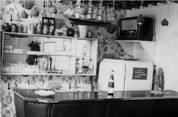
...die „Uffz- Klause“ in der 3./ Bttr

Am 01. Okt. 1970 wurde aus der ehem. Radarbatterie 2 die 3./BeobBtl 23. Im Vorfeld wurden einige Teileinheiten bereits auf ihre neue Aufgabe im Bataillon vorbereitet. So wurde der MatNachw, die InstGrp Rad/Kette und die Radar/FmInst aus der Batterie ausgegliedert. Sonst blieb die Gliederung mit der BttrFüGrp, dem Lichtmesszug, dem Radarzug und einer Wettergruppe.